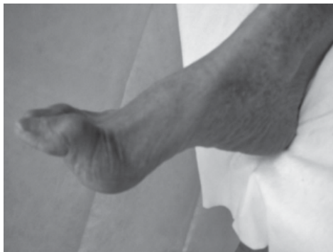
Rycina 1. Neuropatyczna stopa cukrzycowa

W warunkach prawidłowych stopa, której architektura jest bardzo złożona, stanowi misterną konstrukcję przystosowaną do